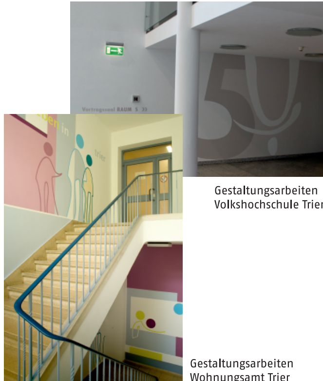
Gestaltungsarbeiten Volkshochschule Trier

Alle grafischen Entwürfe: Gabi Bruckmann für BAU-ART