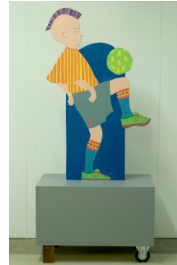
Geburtstagsthron für die Kinder des Hort Ambrosius

In der Kreativwerkstatt von BAU-ART arbeiten die Teilnehmerinnen und Teilnehmer an zwei bis drei Tagen pro Kalenderwoche für vier Stunden. Unter fachlicher Anleitung erweitern sie ihre kreativen und gestalterischen Kompetenzen im Umgang mit unterschiedlichsten Materialien.